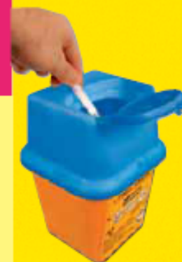
Boîte à aiguille normalisée

Pour plus d'infos contactez votre collectivité