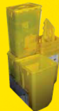
Boîte de stockage en déchèterie