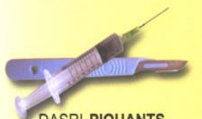
DASRI PIQUANTS, COUPANTS, TRANCHANTS

Le tri à la source consiste à séparer les déchets d'activités de soins en 2 catégories : les déchets assimilables aux déchets ménagers et les déchets à risques infectieux (DASRI).