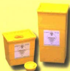
FÛTS EN PLASTIQUE

A usage unique, les conditionnements doivent être intègres, étanches, et adaptés au type de DASRI (piquants*, mous ou liquides).