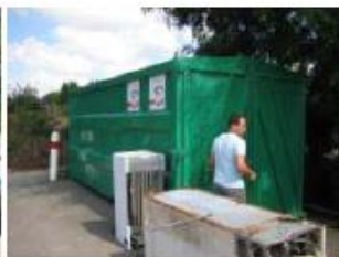
Conteneurs de stockage