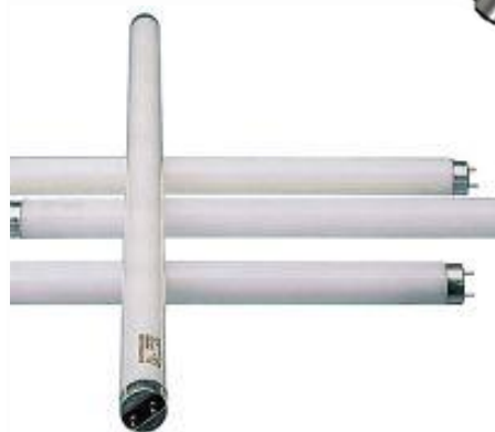
① Tubes fluorescents