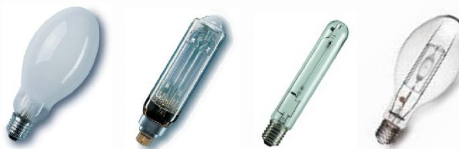
Lampes techniques pour l'éclairage public ou industriel