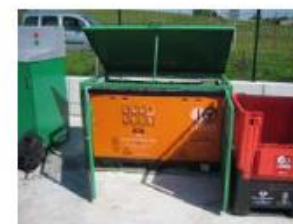
Conteneur sur mesure