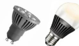
③ Lampes à L.E.D.