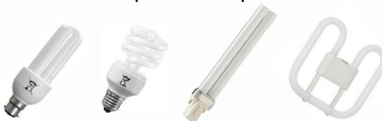
② Lampes fluo-compactes